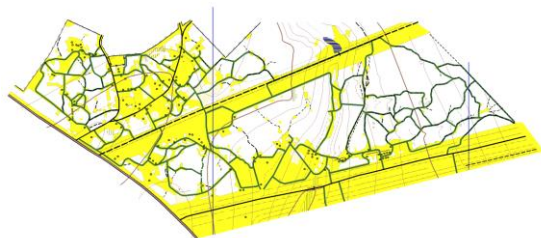
Фрагмент карты 1999 год