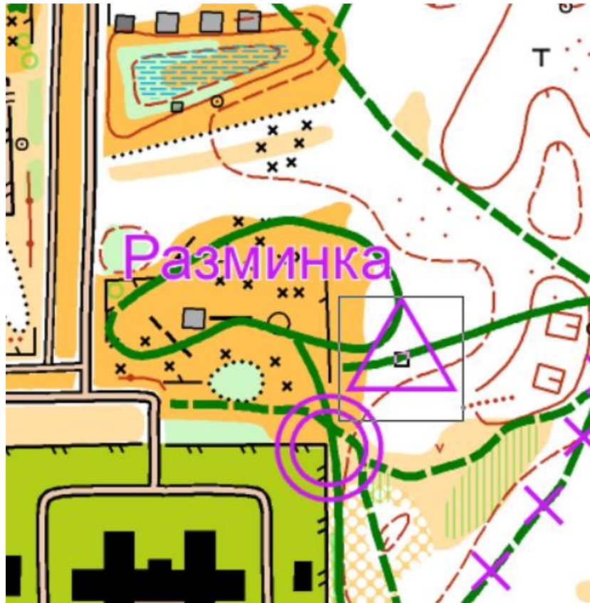
СХЕМА АРЕНЫ СОРЕВНОВАНИЙ