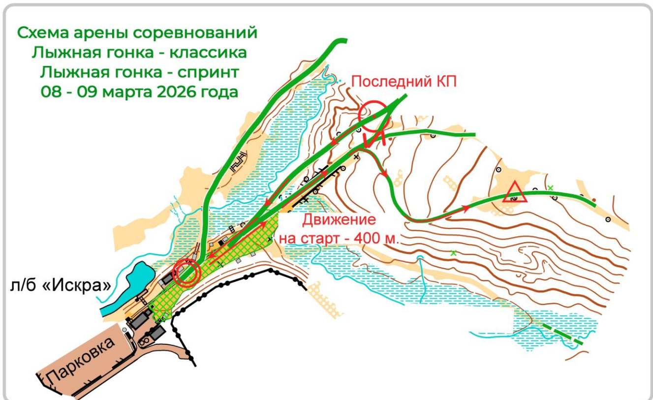
СХЕМА АРЕНЫ СОРЕВНОВАНИЙ 08 – 09 марта 2026 года

Контрольное время для всех групп 60 минут.